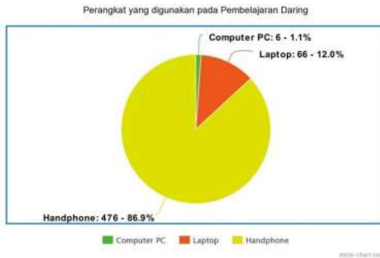
Gambar 3. Persentase Penggunaan Perangkat Pembelajaran Daring

Selanjutnya akan dideskripsikan bagaimana penggunaan perangkat pembelajaran oleh guru dan siswa yang akan digunakan selama proses pembelajaran daring. Berdasarkan hasil angket yang telah dikumpulkan dari guru, siswa dan kepala sekolah, diperoleh bahwa 6 responden (1,1%) menggunakan perangkat Computer PC, 66 responden (12%) menggunakan Laptop, dan 476 responden (86,9%) menggunakan Handphone. Sehingga dapat diketahui bahwa responden lebih sering menggunakan handphone sebagai perangkat pembelajaran daring yang lebih praktis dan mudah digunakan.