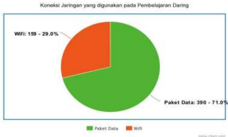
Gambar 4. Persentase Penggunaan Koneksi Jaringan Pada Pembelajaran Daring

Selanjutnya akan dideskripsikan bagaimana penggunaan perangkat pembelajaran oleh guru dan siswa yang akan digunakan selama proses pembelajaran daring. Berdasarkan hasil angket yang telah dikumpulkan dari guru, siswa dan kepala sekolah, diperoleh bahwa 6 responden (1,1%) menggunakan perangkat Computer PC, 66 responden (12%) menggunakan Laptop, dan 476 responden (86,9%) menggunakan Handphone. Sehingga dapat diketahui bahwa responden lebih sering menggunakan handphone sebagai perangkat pembelajaran daring yang lebih praktis dan mudah digunakan.