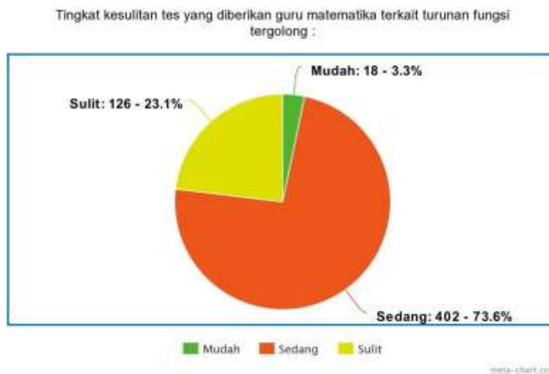
Gambar 5. Persentase Tingkat Kesulitan Matematika Pada Pembelajaran Daring

Dari perhitungan data pada tabel 2 diperoleh rata-rata keseluruhan skor butir angket dengan kriteria nilai 3,55 yang dibulatkan menjadi nilai 4. Dengan demikian, dapat disimpulkan bahwa guru selalu memberikan penilaian terhadap siswa yang ditinjau berdasarkan aspek kognitif, sikap, dan keterampilan pada pembelajaran daring materi matematika terkait materi turunan fungsi.